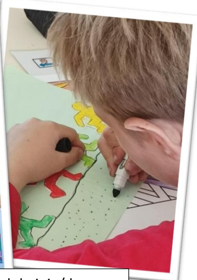
Projet émotions : arts visuel, la joie/ la peur. Classe de CE1/CE2