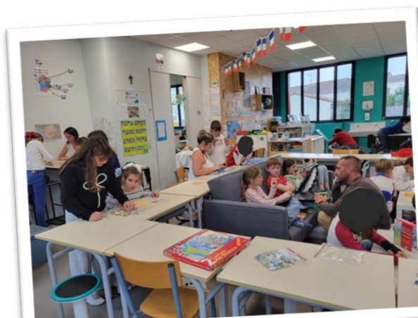
Projet jeux de société : à la découverte de la France. Classe CM1/CM2

Voici le temps des vacances scolaires pour les élèves, elles leur permettront de se reposer après une première période qui leur a permis de reprendre les apprentissages et les projets avec plaisir au fil des jours passés à l'école Sainte Anne.