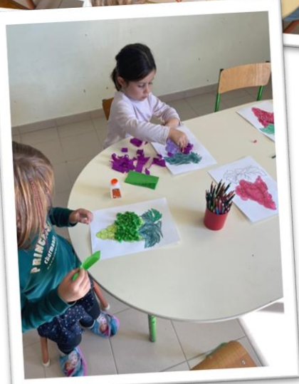
Projet à la découverte de notre environnement : arts visuels, les vignes de Maisdon sur Sèvre. Classe GS/CP