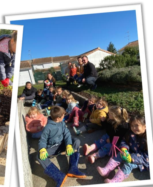
Jardinage (plantation de bulbes) pour embellir notre école avec les élèves de PS/MS et de CP.